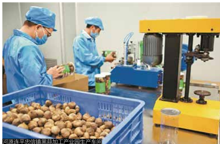
河源连平忠信镇黑蒜加工产业园生产车间

贫困生，面向百色、河池等对口地区出台专项政策，按人均不低于3万元标准落实助学金、生活、交通补助，完成学业后即可在深圳落户就业。深圳技师学院、深圳第二高级技校等目前在读1012名。此外，深圳决定在3年内再招收2000名云南昭通籍贫困家庭学生到深圳就读职业院校，目前深圳职业技术学院和深圳信息职业技术学院已录取昭通籍贫困学生1453名。