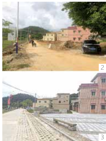
1. 蓝田一角 2. 3. 蓝田村昔今对比 4. 戴德军被村民亲切地叫作“大师” 5. 蓝田村古树公园 6. 蓝田村内各个建筑极其考究细节

中国乡村有多少个蓝田村？点击网上，立马涌出20个。笔者初夏造访的是昔日名不见经传的广东恩平市横陂镇蓝田村。若问此蓝田村有何印象，笔者情不自禁脱口而出：留住乡愁，把根留住。这里展现的是一幅“望得见山、看得见水、记得住乡愁”的美丽画卷。