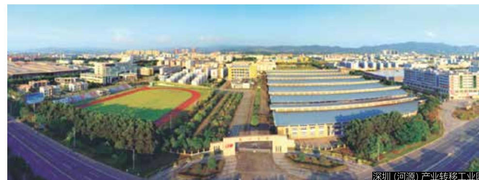
深圳（河源）产业转移工业园