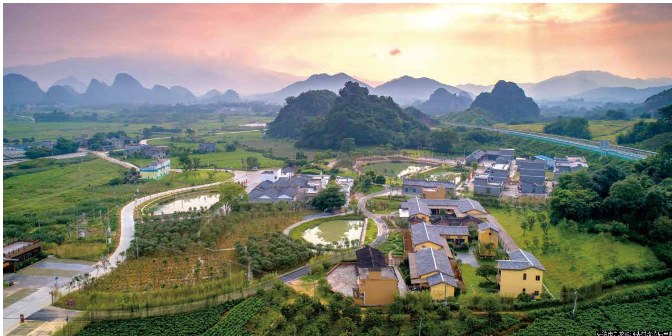
英德市九龙镇河头村改造后全貌

6月30日上午，在2020年“广东扶贫济困日”活动仪式上，碧桂园集团认捐6.8亿元。自2010年起，碧桂园集团连续第十一年参与广东省扶贫济困日活动，已累计捐款36.2亿元。活动现