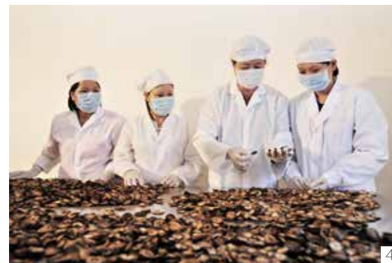
1. 化州橘农采摘化橘红鲜果，满载而归 2. 化橘红鲜果 3. 4. 化州化橘红药材发展有限公司工作人员正在车间进行化橘红干果切片