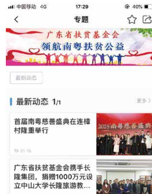
▲ 在新华社APP上发布扶贫信息的专栏