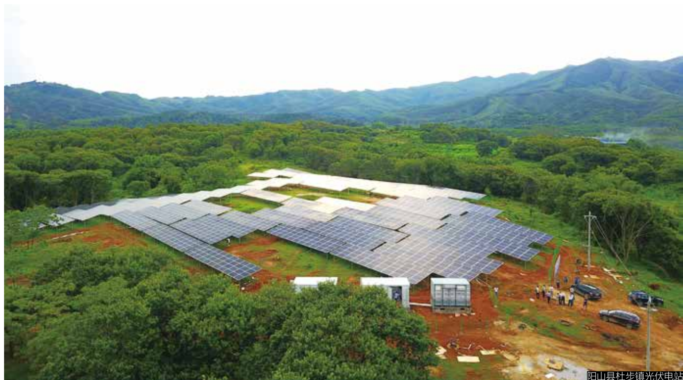
阳山县杜步镇光伏电站

观光旅游为辅”的立体产业扶贫格局，其中最为突出、收效最为明显的就是光伏产业扶贫项目。光伏产业是国家大力支持的新能源产业，而阳山的太阳能资源非常丰富，全年的日照时长在1277.3小时至1741.3小时之间，非常适合开发太阳能。