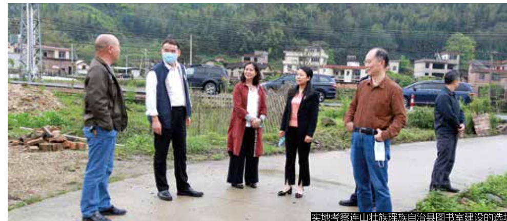
实地考察连山壮族瑶族自治县图书室建设的选址