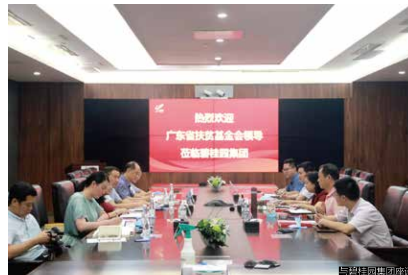
与碧桂园集团座谈

韶关南雄是“中国黄烟之乡”，南雄油山镇下惠村也有种植黄烟的传统，只要黄烟能够丰产丰收，村民收入就有了基本保证。今年初夏，下惠村的烟苗长势喜人，丝毫没有受到疫情影响。更让村民们感到欣喜的是，建行广东省分行通过广东省扶贫基金会捐赠资金用于改善下惠村农田水利和基础设施建设。在建行广东省分行驻村工作队的帮扶下，其中村里4座“民心桥”的落成，待到黄烟收成时，大家不需要再像往年那样为了过河而弯弯绕