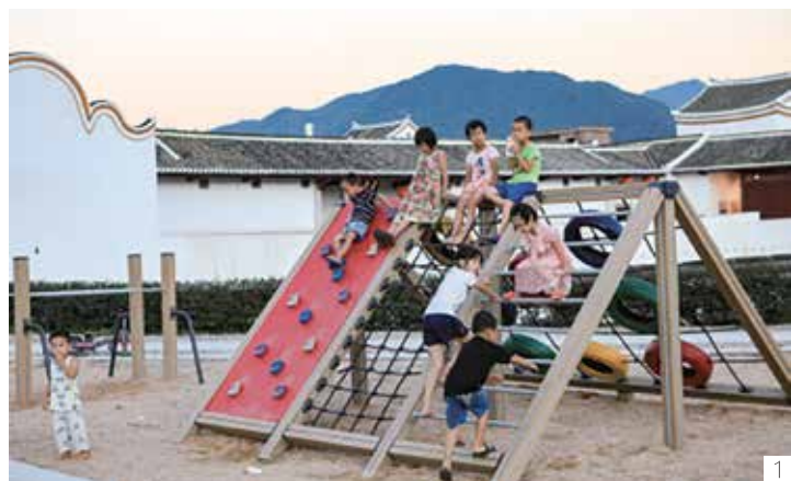
1. 邻里多功能广场 2. 金厢红色文化馆 3. 农耕广场

富的历史人文及自然景观，现存有200多年历史的客家古建筑八角楼、四角楼等文物，2012年1月被授予广东省古村落称号。