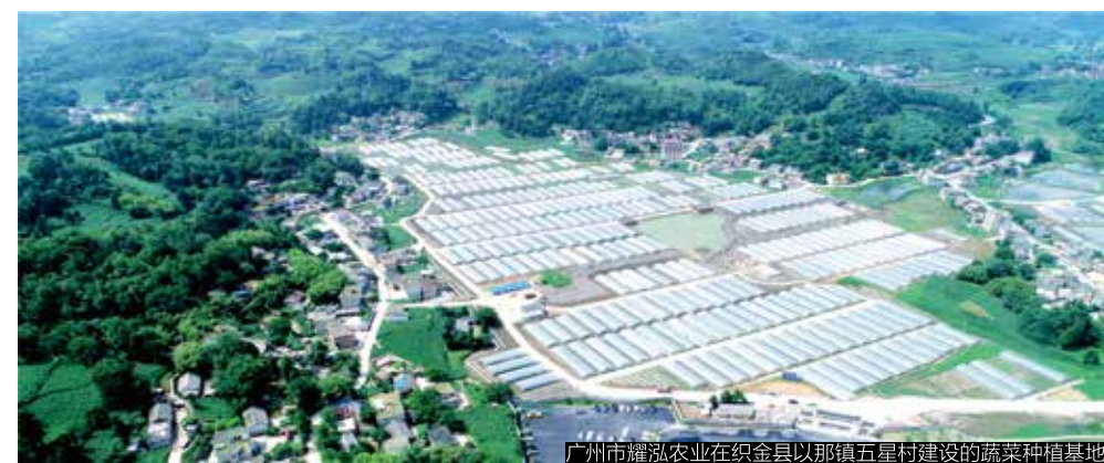
广州市耀泓农业在织金县以那镇五星村建设的蔬菜种植基地

根据阳山县的特色，黄埔区展开了一系列扶贫计划，推动形成了以“光伏为主，特色种养、生态农业、