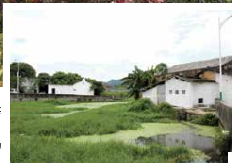
1. 揭西井美村实施碧水行动 2. 实施碧水行动前的村貌

驻村干部为贫困村建设污水处理系统，让老百姓喝上一杯干净水，暖心举动背后离不开名为“碧水行动”的公益项目支持。