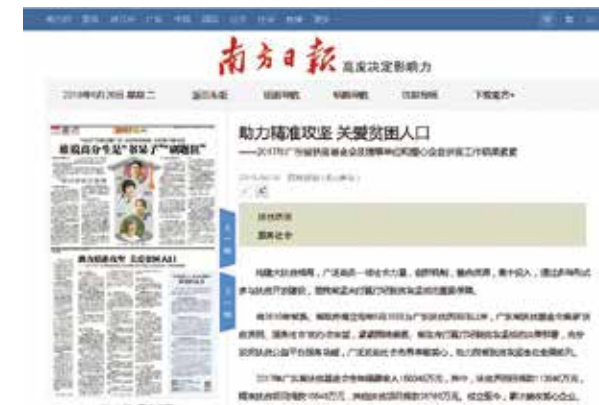
▲ 在《南方日报》发布扶贫纪实新闻