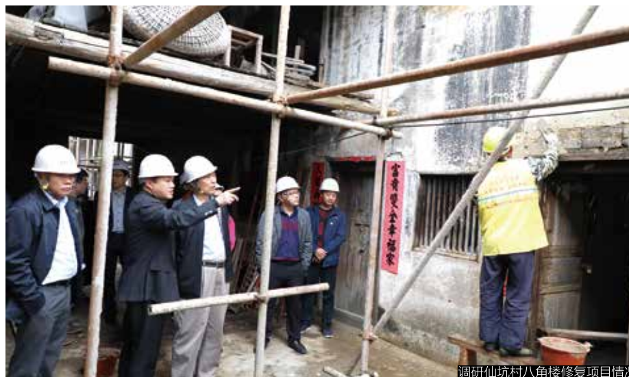
调研仙坑村八角楼修复项目情况