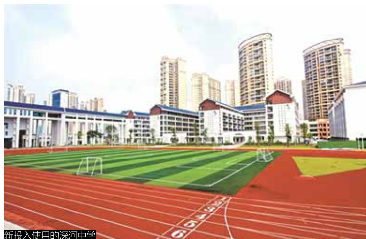
新投入使用的深河中学