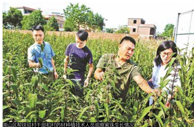
南山区帮扶驻村干部和村药材种植技术人员观察紫珠生长情况