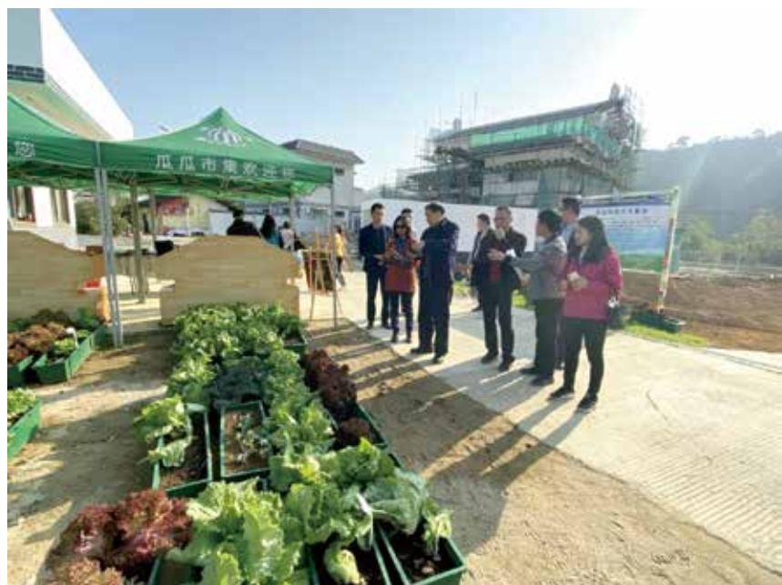
◀ 调研连樟村农业科技示范基地

与捐赠单位及困难群体的桥梁作用。及时向爱心企业及爱心人士传达国家及省有关扶贫政策，让他们真切了解帮扶需求，激发捐赠意愿，引导他们开展扶贫项目，切实提高扶贫工作的精准性、有效性和持续性。多年来，基金会引导一批具有社会责任感的爱心企业与爱心人士积极参与扶贫济困。这些爱心企业与爱心人士不仅慷慨解囊，而且还投入大量人才组建专职扶贫队伍，从产业扶贫、教育扶贫、健康扶贫等多种途径不断创新帮扶模式，成为广东社会扶贫的主力军。