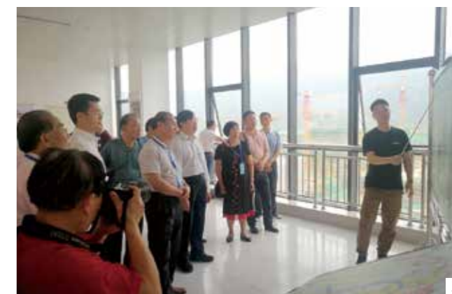
3. 职教之光（荣获全省老区宣传通讯员培训班（第三期）摄影比赛三等奖）