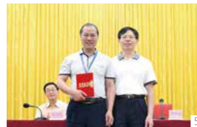
1. 3. 培训班现场