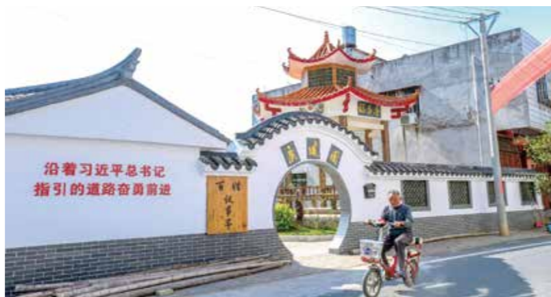
▶太宁村“百姓议事亭”