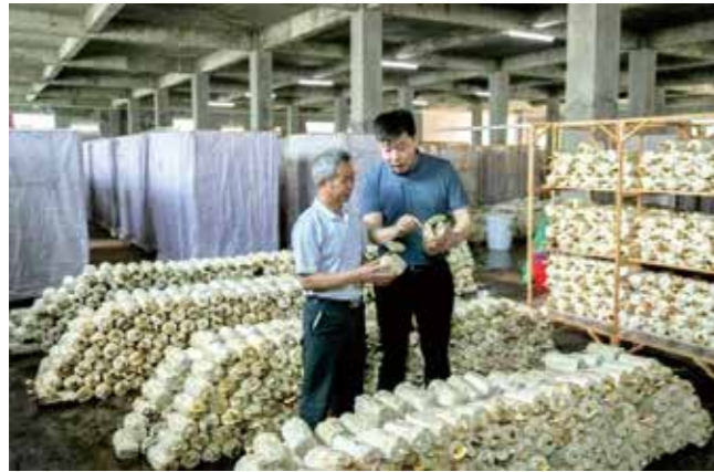
▲旧寨村“灵芝种植基地”