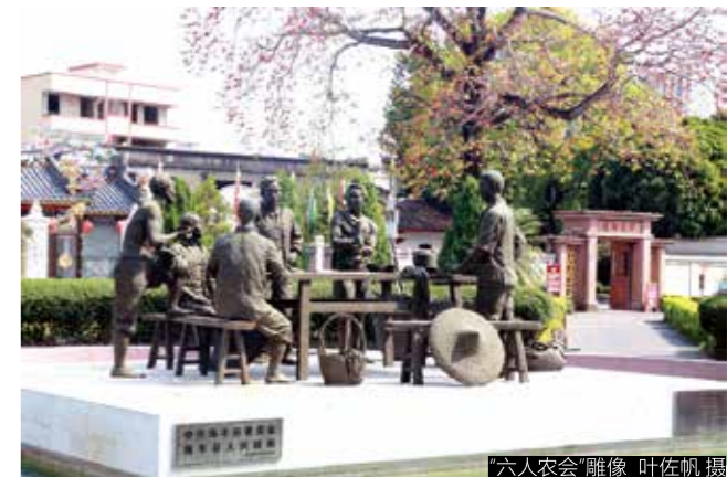
“六人农会”雕像

1924年4月初，彭湃抵达广州。第一次国共合作期间，任国民党中央农民部秘书，随后任共青团广东区执行委员会委员、中共广东区执行委员会委员、国民党广