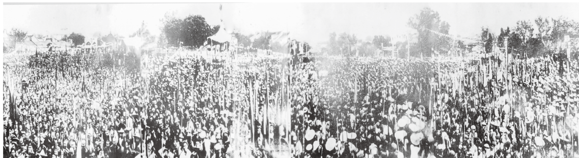
▲海丰县苏维埃政府成立庆祝大会盛况

陆丰县委的领导下，继1927年5月1日举行第1次武装起义后，海陆丰起义军民在同年9月7日、10月底又举行了第2次、第3次起义。