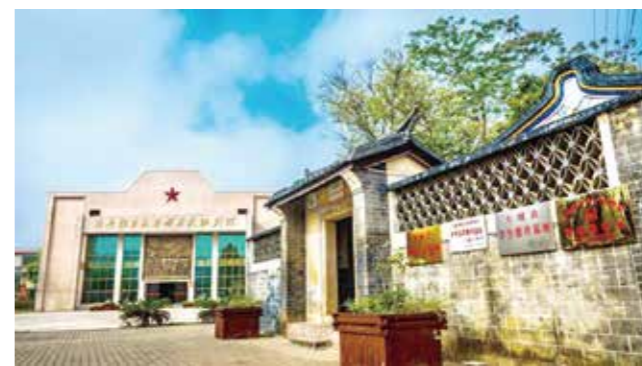
▲大埔角村“南委旧址”

推全县农村基层党组织建设、乡村振兴,经过三年多时间的努力,大埔县的旧寨、大埔角和太宁等3个村上榜广东60个“红色村”。以下是三个红色村的振兴实践的经验精选: