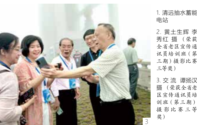
1. 清远抽水蓄能电站

38.8万吨，对助力实现碳达峰、碳中和目标具有重要意义。截至目前，该工程建设获得国家专利38项、省部级科技进步奖15项；国家工法、QC成果16项。清