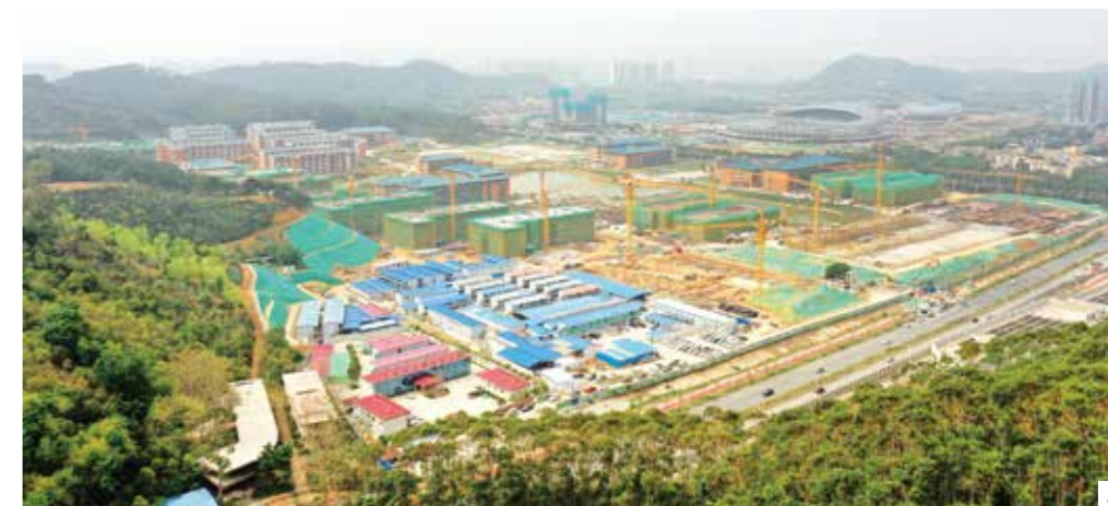
1.2. 建设中的省职教城

在省委省政府及有关部门大力支持下，职教城已取得了初步的成效。目前止，省职教基地已进驻高校10所。