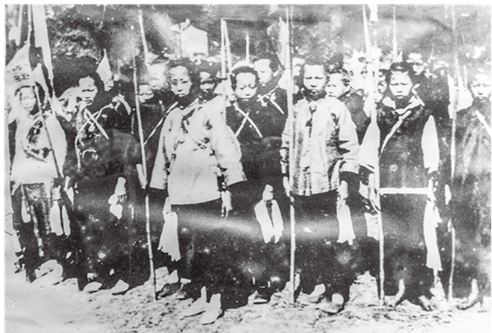
▲海丰县妇女粉枪队参加庆祝海丰县苏维埃政权成立大会留影

20世纪20年代，在中国共产党的领导下，在老一辈无产阶级革命家彭湃等的引领下，伴随着革命洪流而开始觉醒的海陆丰妇女，努力挣脱封建束缚，走出家门，走进学堂，解放思想，自立自强，参加农会，参加妇女武装。她们不畏生死，信念坚定，用生命阐释了“巾帼不让须眉，红颜更胜儿郎”，在海陆丰革命历史上留下浓墨重彩的一笔。