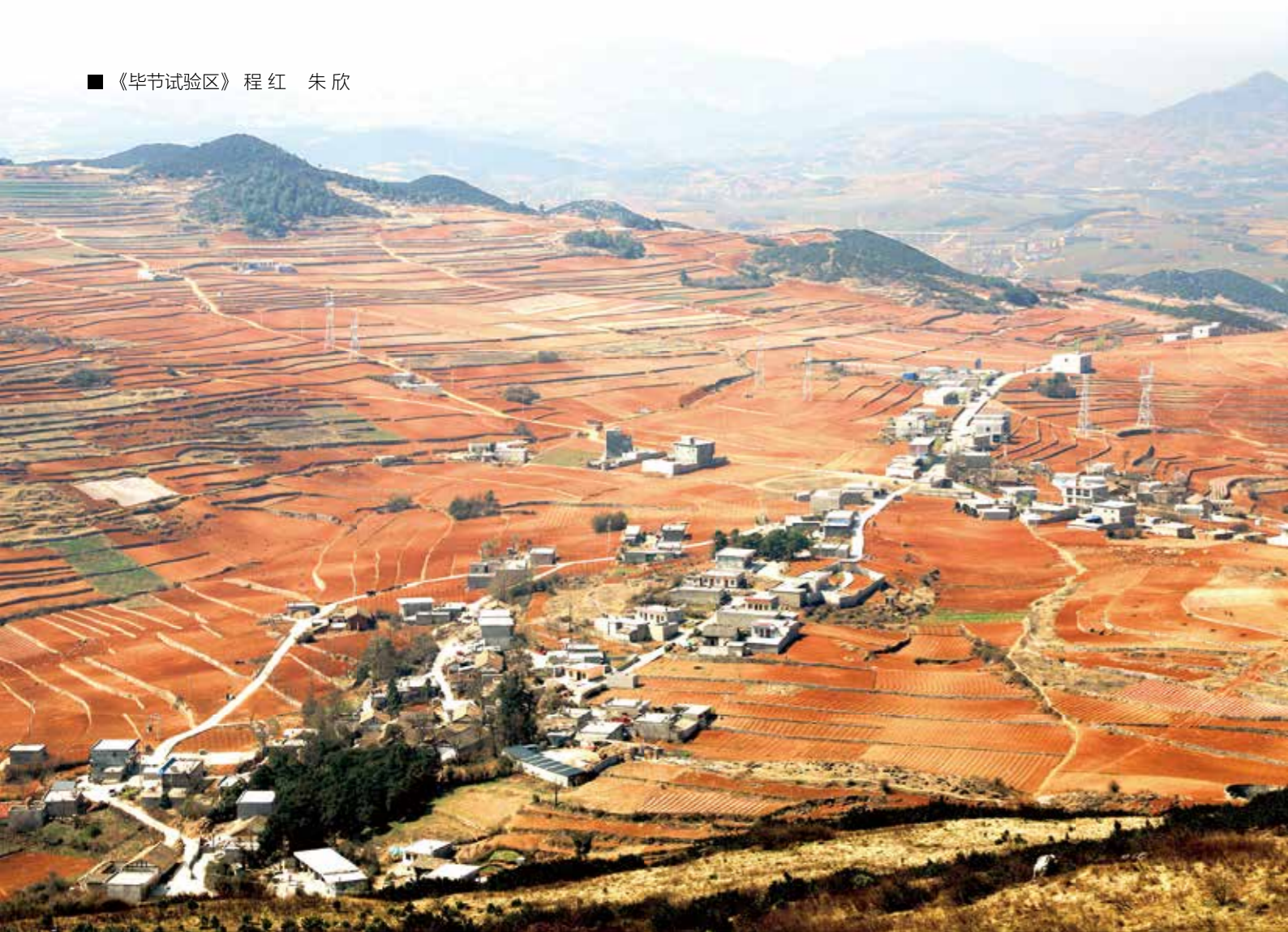
▲五星社区呈现出一派生机勃勃的新景象

迤那，在彝语中意为“美丽的海子”，位于威宁自治县西北部。曾经，五星社区生态环境脆弱、自然条件恶劣，成为威宁县乃至毕节市脱贫攻坚的“硬骨头”之一。穷则思变，困则谋通。在脱贫攻坚工作中，迤那镇