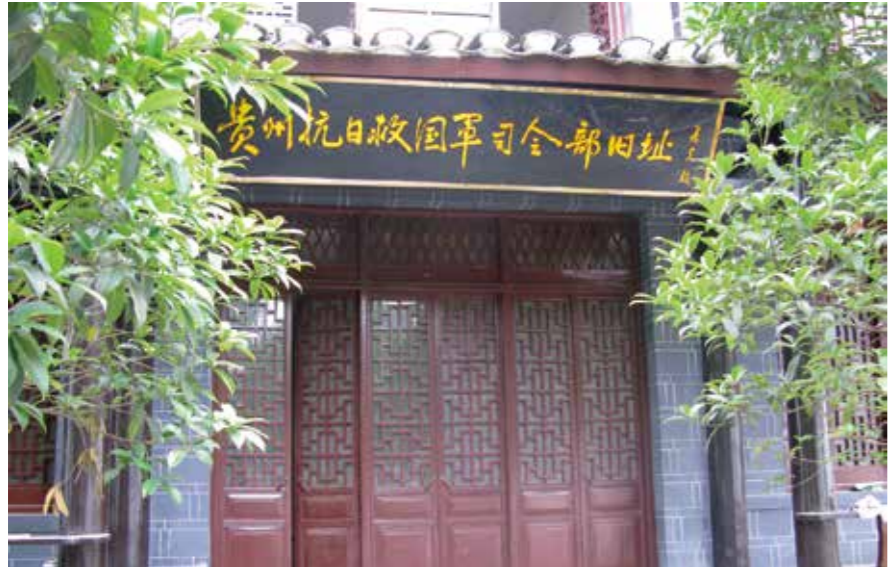
贵州抗日救国军司令部旧址

在毕节老城区水东门古老石板街右边通往十字街的中段，有一条旧时连接游击衙门的小巷。小巷入口不远处有一道青砖院墙，中间置一式两扇木门，门头上方原是雕花、穿檐、吊斗、悬空的门楼。进了门楼便是一方小院。