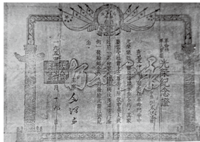
▲由毛泽东主席签署的董朗烈士证书

命撤离激石溪根据地。由于国民党军的进剿烧杀,激石溪2000余军民惨遭杀害,无数房屋被烧光。“红二师”虽然撤离激石溪,但“红二师”的精神和业绩仍然留在根据地。董朗率红二师在东江的战斗历程,是一部威武雄壮的史诗,他为中国人民的革命事业作出了巨大贡献。